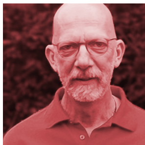
Peter Hoelzel Rennbüro